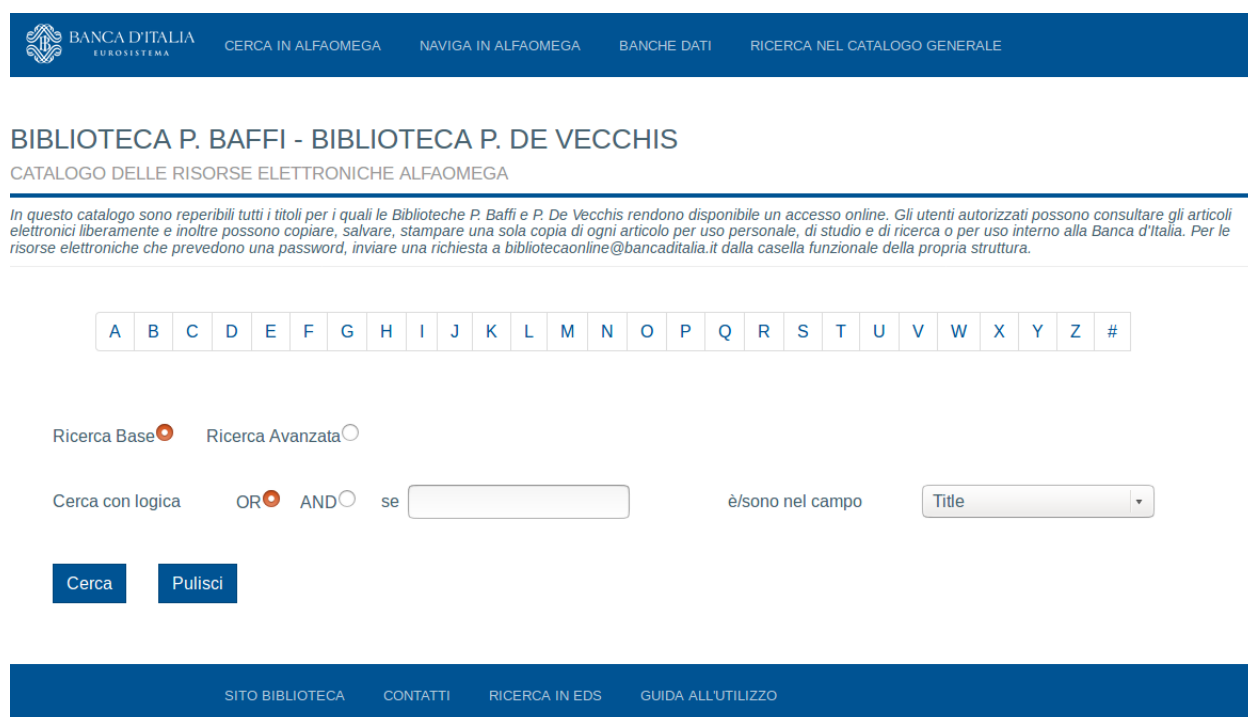
Figura 2-7: Pagina Cerca in Alfaomega - Ricerca Base

Una volta inseriti i criteri di ricerca cliccando sul pulsante Cerca si va alla pagina di navigazione. Per ulteriori dettagli sulle funzioni di ricerca base ed avanzata si rimanda alla sezione 3.1 della guida relativa agli Utenti.