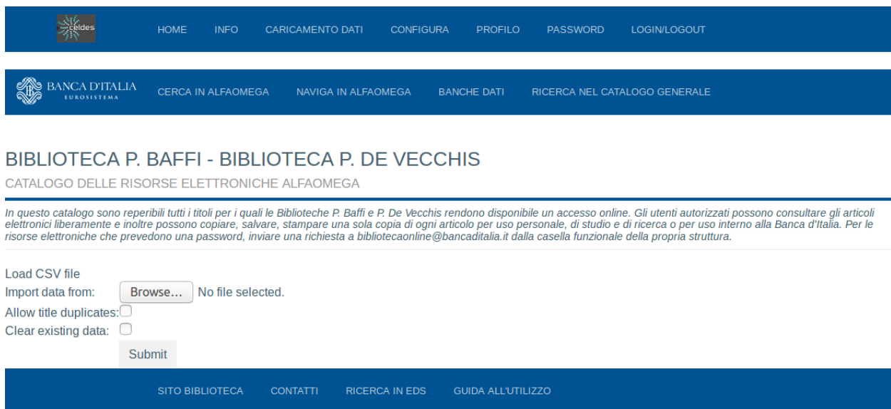
Figura 2-6: Pagina Caricamento Dati

2.2) viene caricato un titolo già presente nel database e si consentono titoli duplicati: il titolo caricato viene inserito normalmente e nel database esisteranno quindi titoli duplicati.