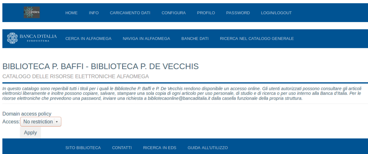
Figura 2-2: Pagina Configura