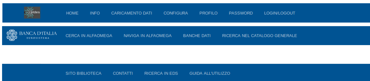
Figura 1-1: Struttura delle pagine per il Gestore

In particolare tutti gli utilizzatori (Gestori ed Utenti) visualizzano le barre di Header e Footer, mentre solo il Gestore visualizza la barra Admin, dalla quale è possibile accedere alle funzionalità di gestione del dominio e del database.