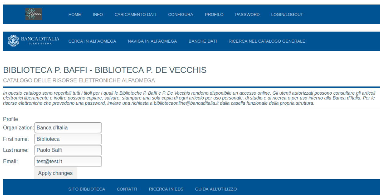
Figura 2-3: Pagina Profilo

Le pagine che consentono di modificare il profilo Utente e le credenziali di accesso ad un dominio sono rispettivamente accessibili dalla barra Admin/Profilo e da Admin/Password.