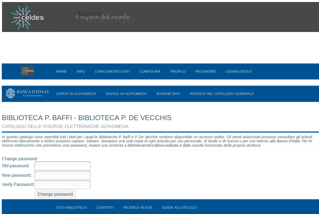
Figura 2-4: Pagina Password